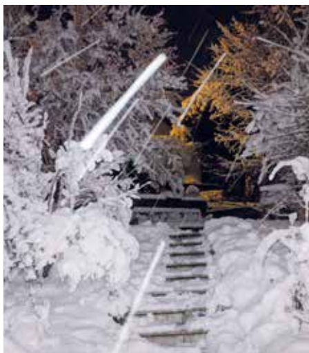
Diese Stiege muss noch geräumt werden

Fast alle Fußwege fallen in die Betreuungspflicht der Gemeinde und