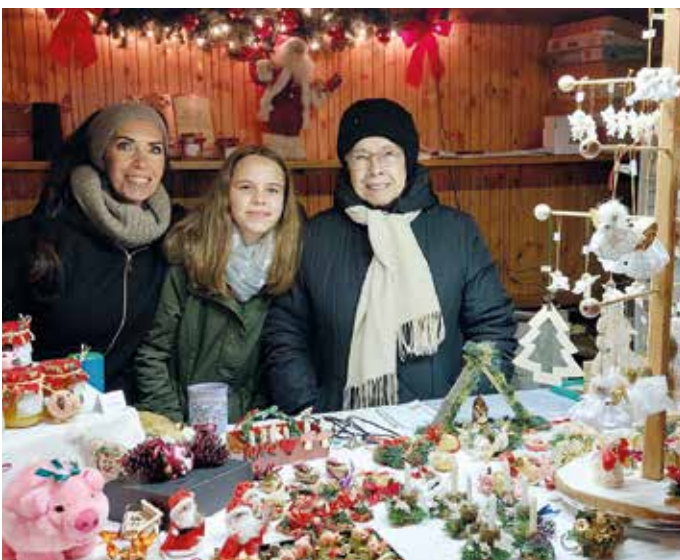
Weihnachtliche Geschenkartikel am Adventmarkt