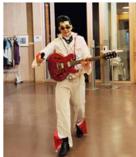
A little more action!

Es wurde getanzt, gelacht, sich ausgetauscht und vor allem wurde viel geplaudert. Die Rückmeldungen waren so positiv, dass am Ende das Versprechen Nächstes Jahr wieder gegeben wurde.