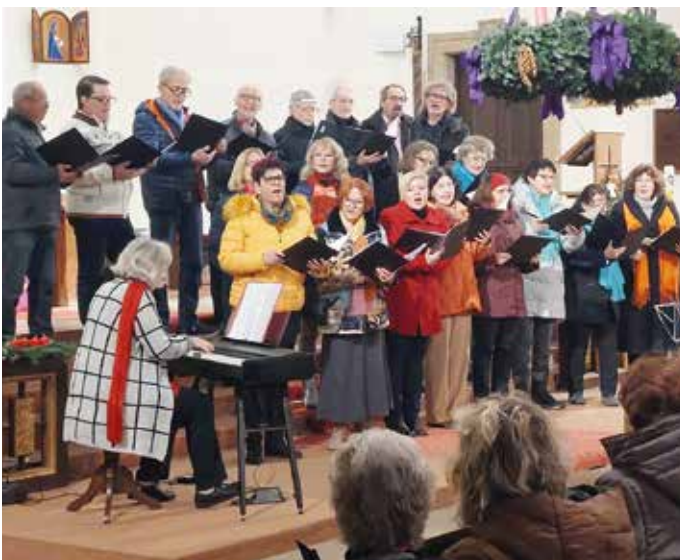
Das Weihnachtskonzert im Wienerwalddom war ein Genuss.