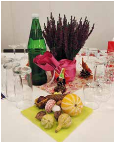
Essen, trinken ...