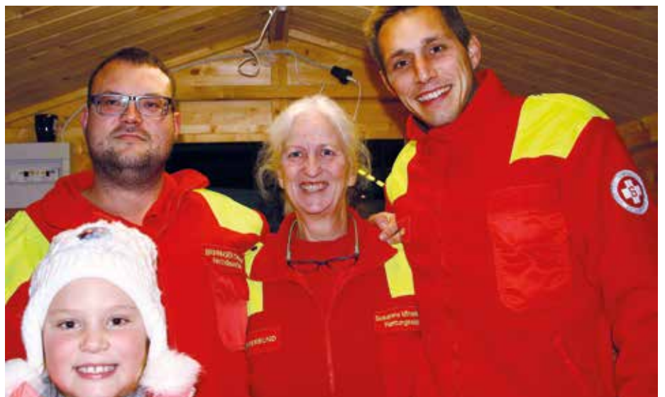
Unsere Rettung war mit einem Stand und einem Rettungswagen für Notfälle vor Ort.