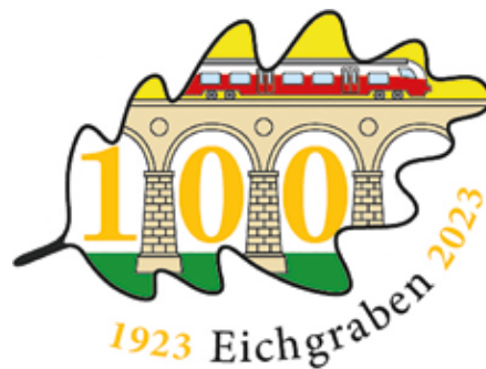
Jubiläumslogo - 100 Jahre Eichgraben

Außerdem werden wir auf unserer Homepage und im Newsletter laufend darüber berichten.