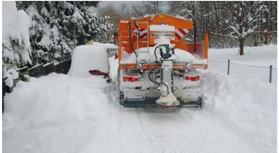
Der Schneepflug benötigt eine Durchfahrtsbreite von mindestens drei Metern.

so ist es notwendig, 23 Wege aufgrund verschiedener Kriterien, wie Kosten, Verkehrsbedürfnis oder das Vorhandensein zumutbarer Umleitungen, mit einer Wintersperre zu belegen.