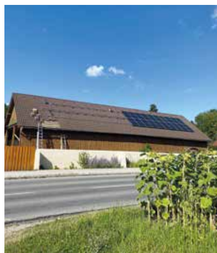
Photovoltaikanlage am Bauhof

Schlussendlich ist die Wahl auf einen Eichgrabner gefallen, der ein spannendes Projekt vorgestellt hat, wofür er wirklich brennt. Stephan Bruckmeiers Konzept beinhaltet vieles, das bereits in der