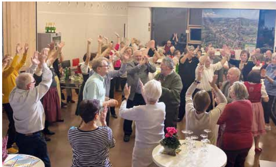
... tanzen, feiern – so lautete das Motto des schwungvollen Abends.