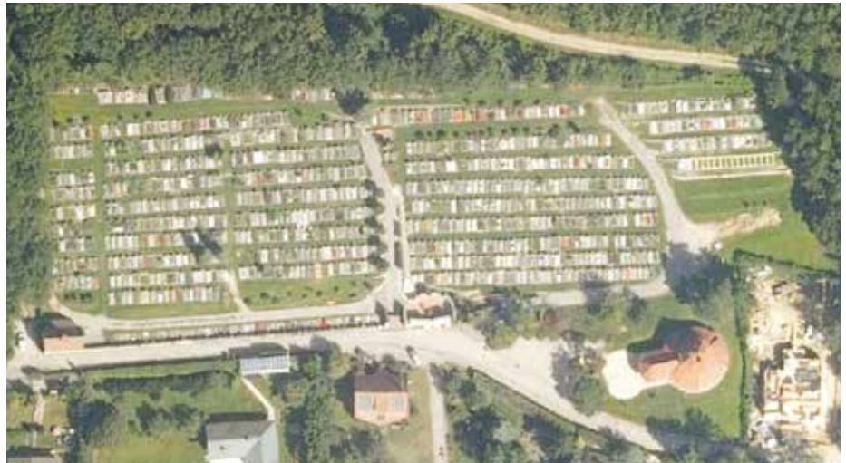
Luftaufnahme des Areals des Friedhofs Eichgraben inkl. Aufbahrungshalle

Der erste Schritt wurde 2019 mit der Sanierung des Urnenhaines gesetzt. Heuer folgte die Erneuerung der Absturzsicherungen, Handläufe und Beschriftungen