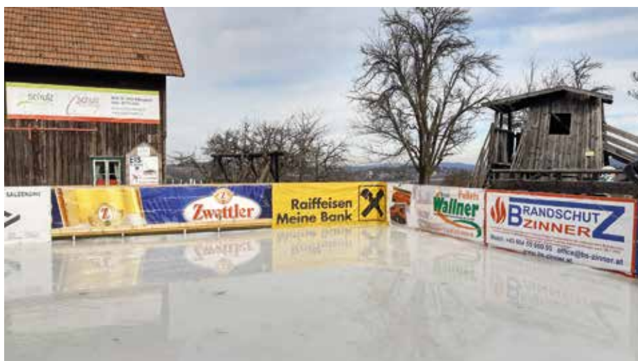
Den Eislaufplatz bei der Schulzhütte besuchen auch viele Eichgrabner.

Die zeitgenossenschaft.wienerwald hat im Rahmen des Herbst-Brückenfestivals zwei Veranstaltungen organisiert, wofür es 2.000 € aus dem Topf der Kultursubventionen gibt. Einen Rückblick und einige nette Videos über unsere Vereine gibt es hier: