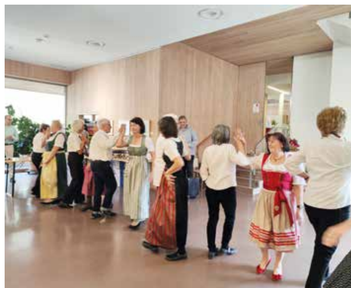
Die TANZEINLAGE von „Tanz ab der Lebensmitte“