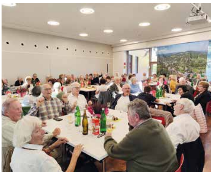
Der Gemeindesaal war gut besucht.