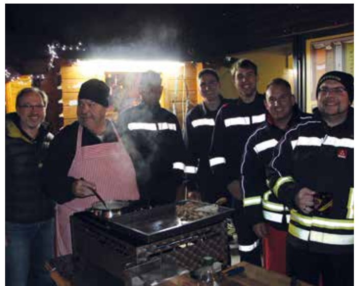
Bei der Feuerwehr gab es Deftiges vom Grill