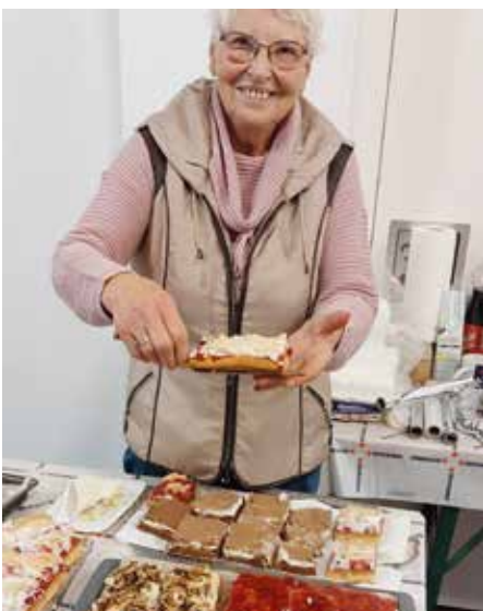
Zum Anbeißen gute Kuchen und Torten