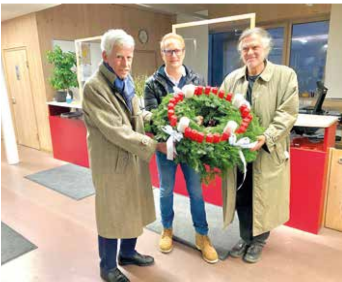
Der Wichernkranz ist der Vorgänger unserer heutigen Adventkränze.

Die vielen Vereine, Organisationen, Kunsthandwerker und Privatpersonen gaben sich große Mühe, für alle Geschmäcker etwas anzubieten.