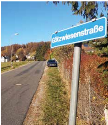
Götzwiesenstraße - noch ohne Gehsteig

Der Gehsteig in der Götzwiesenstraße wird 2023 errichtet und ist