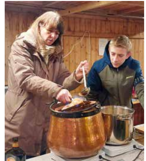
Hochprozentiges aus dem Kupferkessel