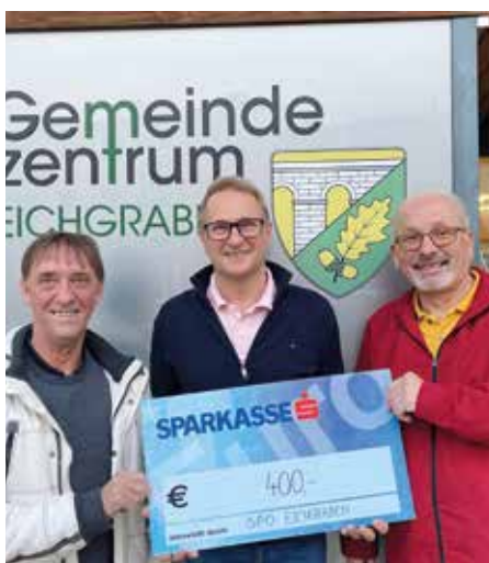
Reinerlöse wurden gespendet.

Auch im kommenden Jahr werden wir einen besonderen Fokus auf