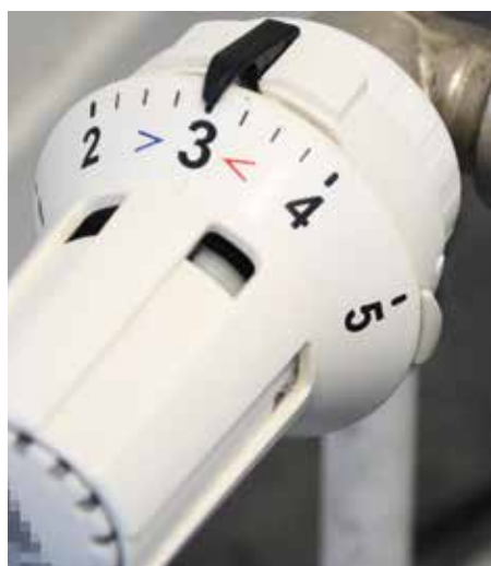
Zusätzl. Heizkostenzuschuss der Gemeinde

Der Eislaufplatz erfreut sich auch in Eichgraben großer Beliebtheit, daher wird dieser auch heuer mit 1.500 € gefördert.