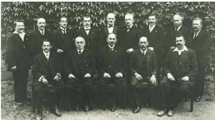
Gemeinderat anno 1923 – erkennen Sie vielleicht einen Ihrer Vorfahren?

Auch das Logo gibt es schon: Aus den vielen Zeichnungen, die die Kinder unserer Schulen zum