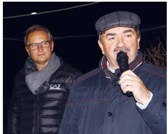
Unser Herr Bürgermeister und Herr Pfarrer eröffnen den Markt