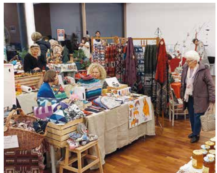
Kunsth Handwerk im Innenbereich des Gemeindezentrums