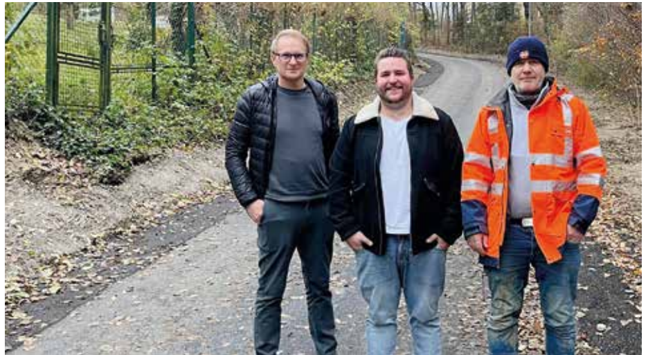
Die Arbeiten an der Nestroystraße wurden Ende November erfolgreich abgeschlossen.

Am Anfang des Jahres konnte die Weidenstraße und der obere Teil der Sonnleitenstraße in einen ordnungsgemäßen Zustand versetzt werden. Bereits im Vorfeld erfolgte auch ein Tausch der Wasserleitung.