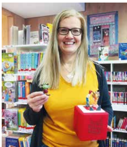
Tonies sind bei den Kids sehr beliebt