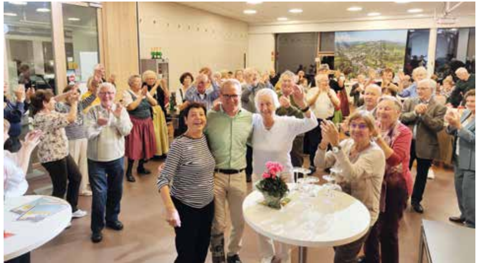
Die Stimmung am Fest der Senioren und Pensionisten war einfach mitreißend.

Im Jahr 2022 haben wir die Eichgrabner Vereine in den Vordergrund gestellt. Unsere Vereine werden von vielen Menschen getragen, die Tag für Tag mit ihrer Leidenschaft und großem persönlichen Einsatz